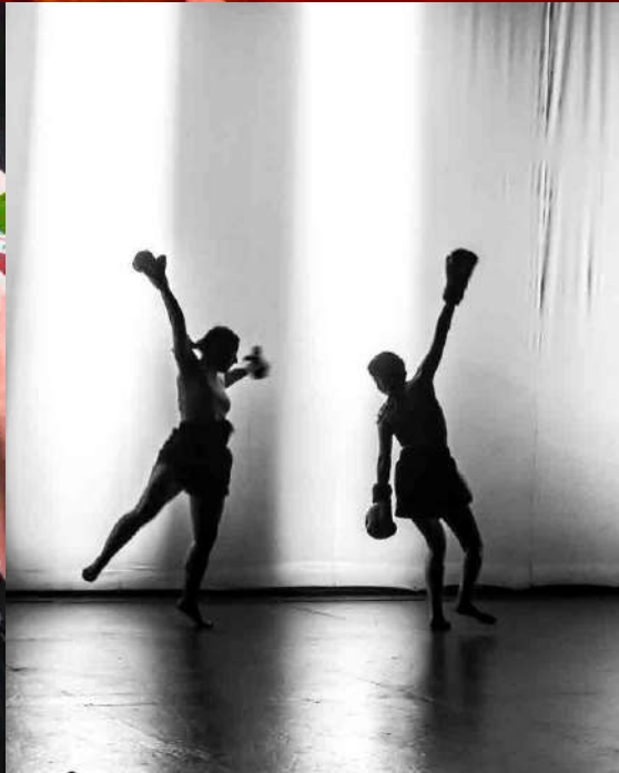
Algo de ti / Animales de Lumiere (videoclip) Actriz y bailarina Escenas (2023)