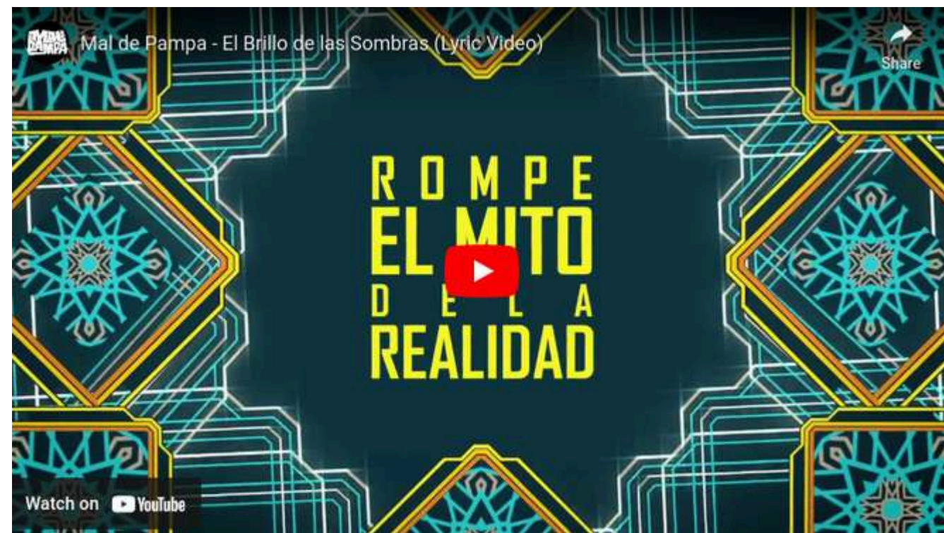
BANDA MAL DE PAMPA EL BRILLO DE LAS SOMBRAS (Interprete bajista)