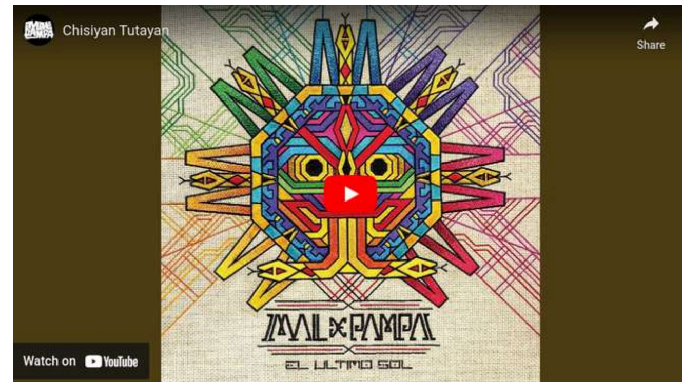
BANDA MAL DE PAMPA EL NUEVO INFIERNO (FEAT ENTRÓPICA) (Interprete bajista)