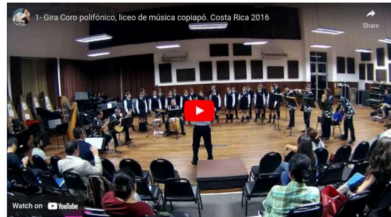
GIRA CORO POLIFÓNICO Y ENSAMBLE MUSICAL COSTA RICA (Interprete Bajista)