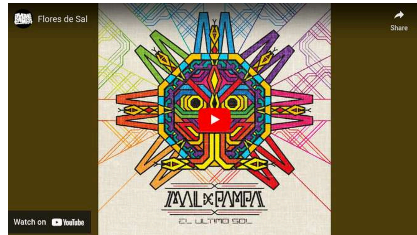
BANDA MAL DE PAMPA FLORES DE SAL (Interprete bajista)