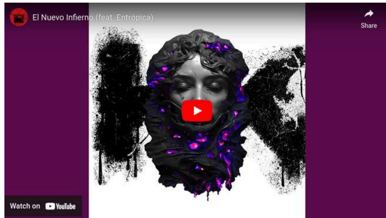
BANDA MAL DE PAMPA EL NUEVO INFIERNO (FEAT ENTRÓPICA) (Interprete bajista)